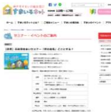
すまいるネットホームページ セミナーの案内